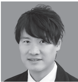
生年月日 1976年1月13日生 当社株式所有数 無し