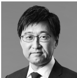
生年月日 1966年11月28日生 当社株式所有数 無し